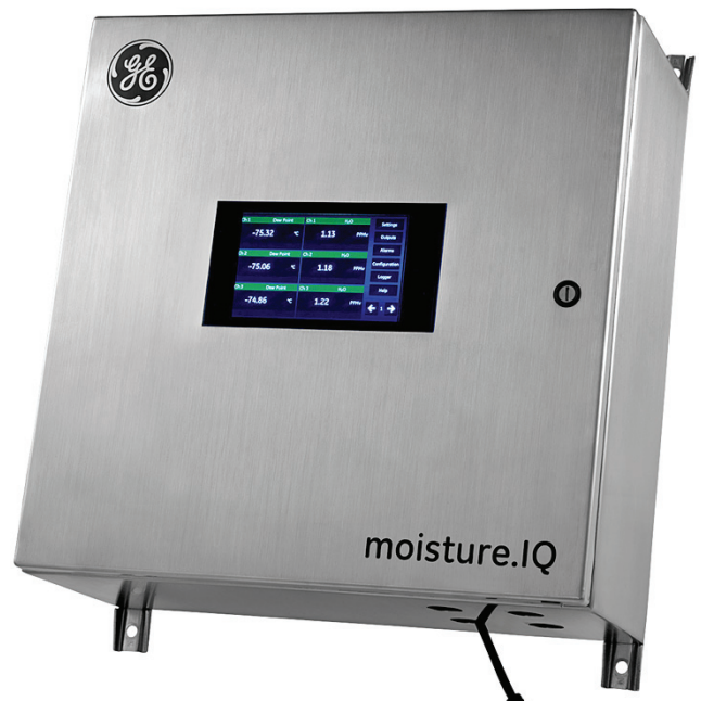
Versión a prueba de intemperie