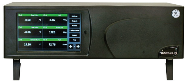
Versión de montaje en banco

El moisture.IQ puede aceptar entradas de sondas Panametrics MIS y sondas de la serie M que estaban disponibles para los analizadores Moisture Image serie 1 y Moisture Monitor serie 3. Las sondas MIS (MISP y MISP2) proporcionan entradas integrales de humedad, temperatura y presión. Los datos de calibración de esos sensores se almacenan digitalmente. Cuando se conecta al analizador, los datos de calibración se descargan en el moisture.IQ.